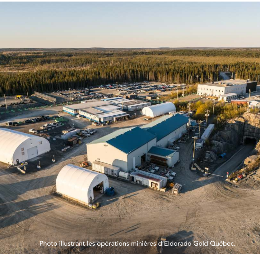
Photo illustrant les opérations minières d'Eldorado Gold Québec.

Peu importe sa durée, il est reconnu que les activités minières génèrent des répercussions sociales significatives tout au long de leur cycle de vie, de la phase d'exploration, jusqu'à la fermeture du site.