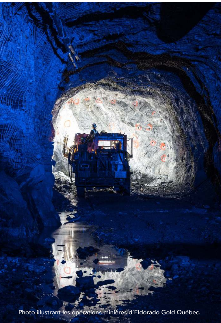
Photo illustrant les opérations minières d'Eldorado Gold Québec.

Centraide reconnaît l'apport exceptionnel de l'industrie minière dans le soutien aux communautés et propose un plan de visibilité et de reconnaissance aux membres contributeurs du FISIM.